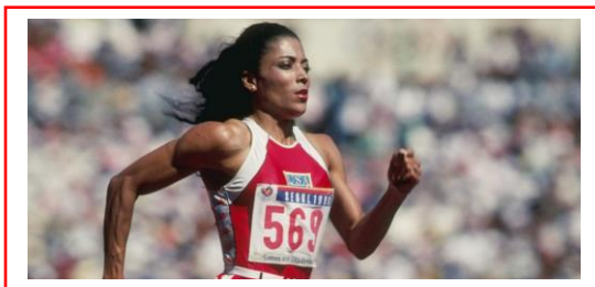
Florence Griffith Joyner